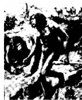
Небрасский человек — реконструкция по зубу

В 1891 году голландец Эжен Дюбуа приехал на Яву в поисках “недостающего звена”. Там он нашел два черепа, похожих на черепа современного человека, и молчал о них почти 30 лет! Затем он нашел человеческую берцовую кость, а в четырнадцати метрах — затылочную часть черепа обезьяны и несколько зубов. Он сделал вывод, что эти разбросанные фрагменты принадлежали одному существу, и объявил, что наконец обнаружил обезьяночеловека — это существо по сей день называют яванским человеком .